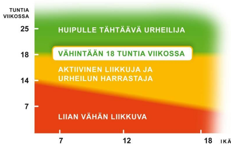
Urheilevan lapsen ja nuoren liikkumis- ja harjoittelumäärä viikossa